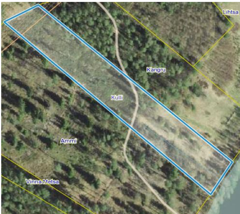
Joonis 2. Maa-ameti kitsenduste kaardi väljavõte