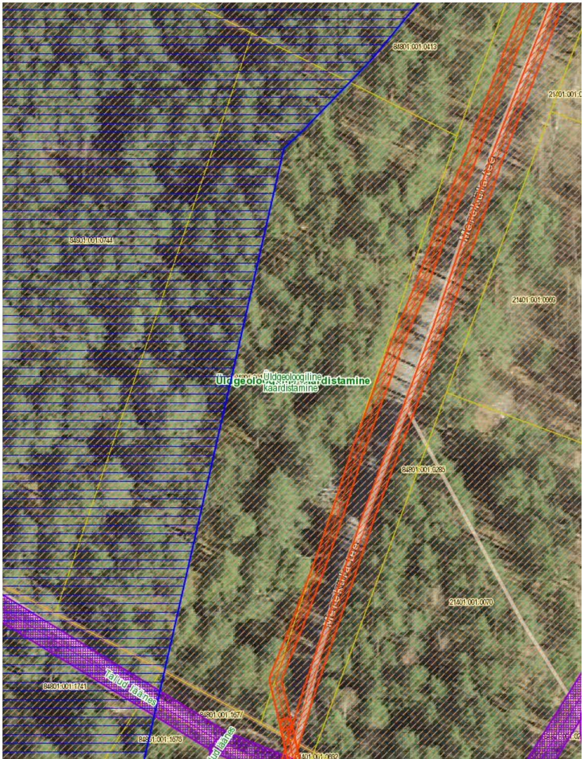
Joonis 2. Maa-ameti kitsenduste kaardi väljavõte