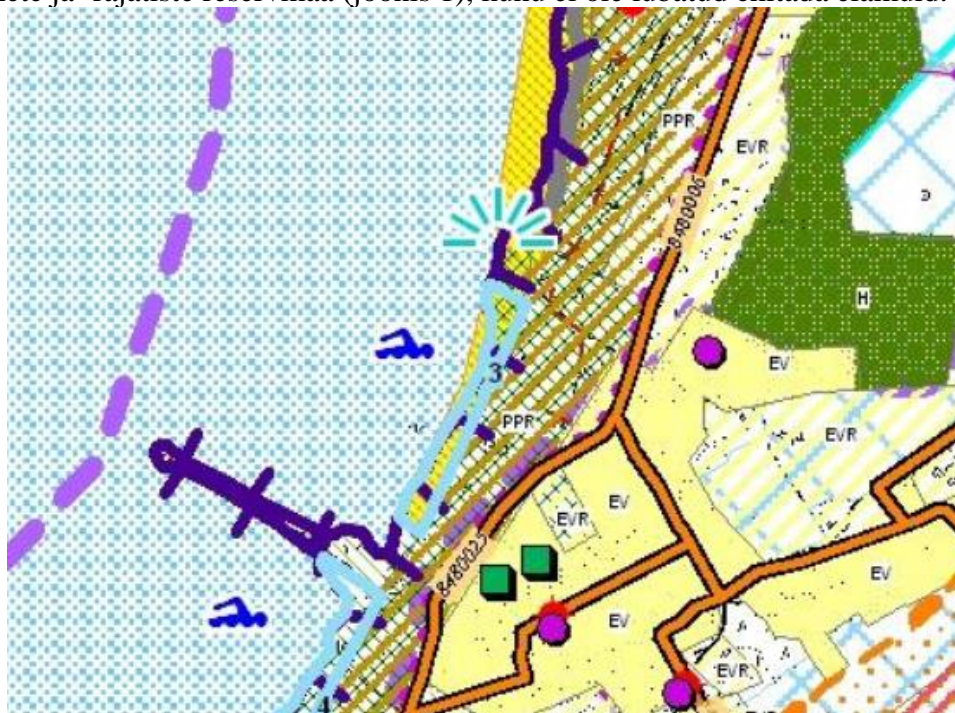
Joonis 1. Kehtiva Tahkuranna valla üldplaneeringu väljavõte

Kehtiva Tahkuranna valla üldplaneeringu kohaselt asub Kullimetsa kinnistu detailplaneeringu koostamise kohustusega alal. Üldplaneeringuga määratud maakasutuse juhtfunktsioon on puhkehoonete ja -rajatiste reservmaa (joonis 1), kuhu ei ole lubatud ehitada elamuid.