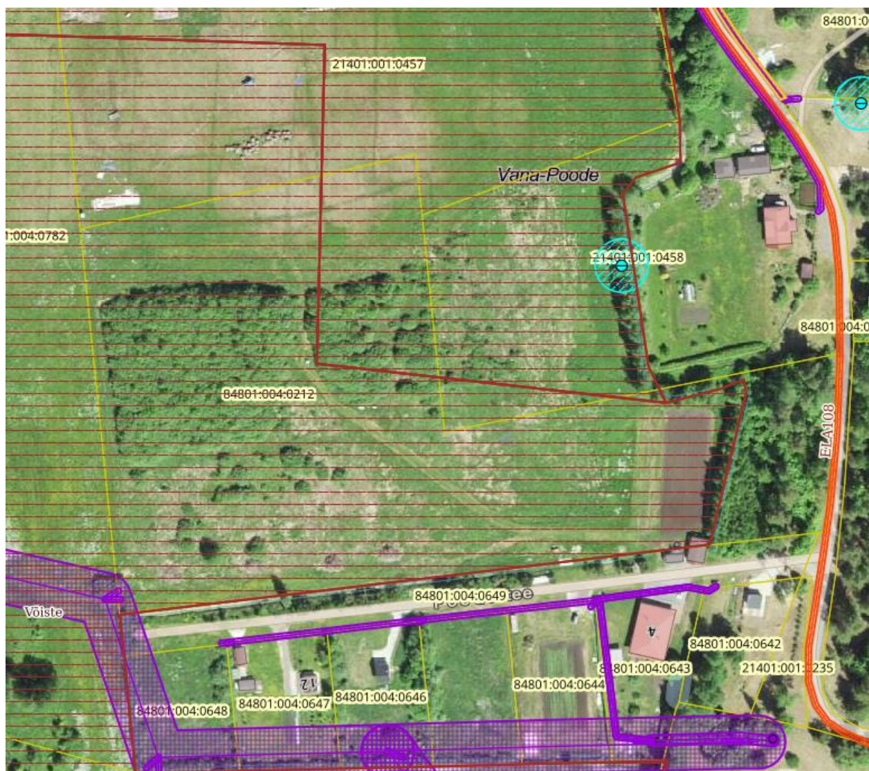
Joonis 2. Maa-ameti kitsenduste kaardi väljavõte