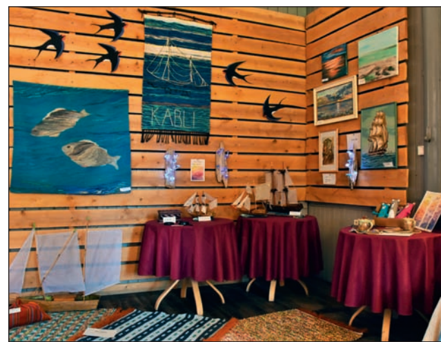
Liiviranna rahva käsitöö näitus.

Eesti Vabariigi 100. juubeli raames koguti uuest Häädemeeste vallast kokku palju erinevat käsitööd ning kunsti.