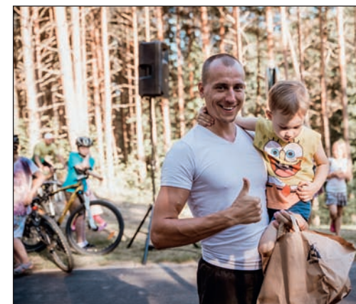
Hetki Uulu kergliiklustee avamiselt.