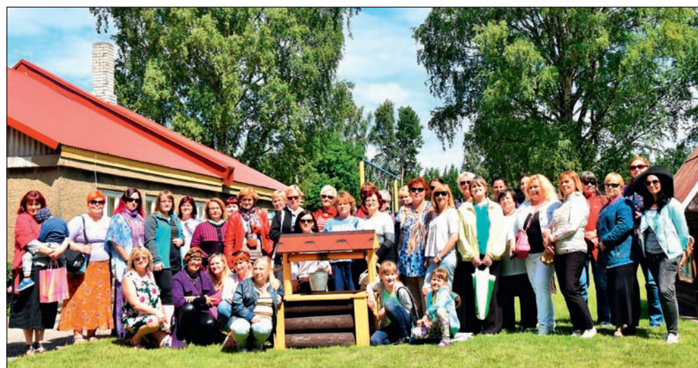
Tallinna lasteaia töötajad Kablis.