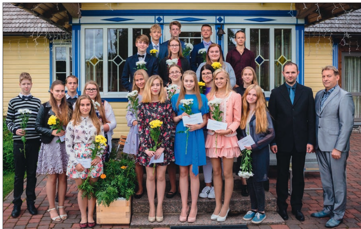
Vastuvõtul osalejad ühispiledil Nurka talus.

Arukaid valikuid soovides, Helve Reisenbuk abivallavanem