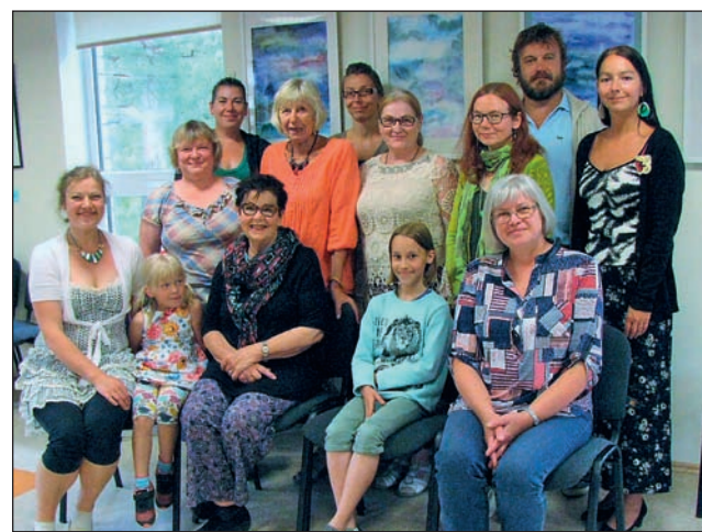
Kursuslased koos juhendajaga.