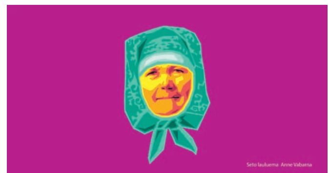
Sõna looja: Anne Vabarna

Eesti Kirjandusmuuseumi Eesti Rahvaluule Arhiiv Euroopa kultuuripärandi aasta 2018