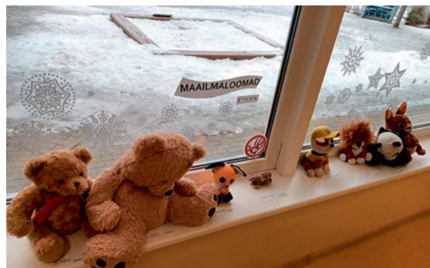
Maailma loomade näitus.

gused kahjulikud. Uuriti luustikku ja kogu seda siseorganite süsteemi. Põnev oli küll, aga: „Ei-ei-ei! MINA küll arstiks ei hakka! Vaata, väljastpoolt võib inimene ju väga ilus olla, aga seestpoolt – juuuuuuh!”. Nii kõlas ühe koolieeliku filosoofilise maiguga mõtteavaldus.