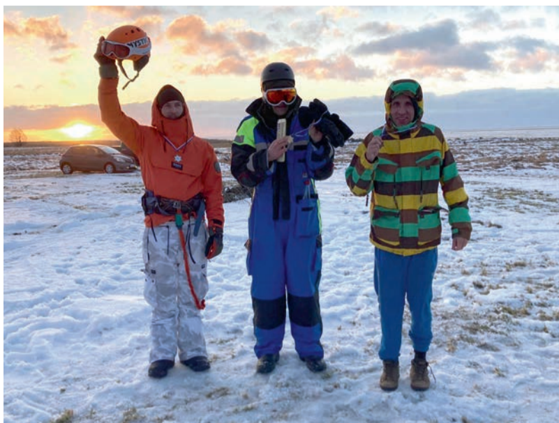
Lumelaua kiiruse esikolmik

“Kui suusamehed muretsesid, kuidas veelompidest läbi saada, siis minul lumelauaga seda muret polnud. Mulle tundus hoopis jääl hakkama saamine raskem ja need kartused osutusid õigeks, sest lumelaud on ikkagi lumel