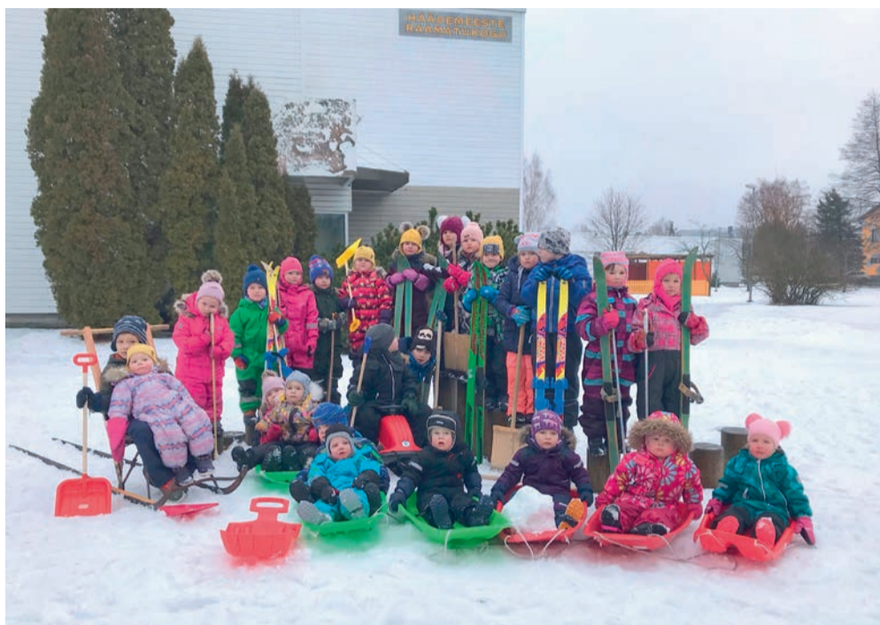
Talverõõmud lasteaias.