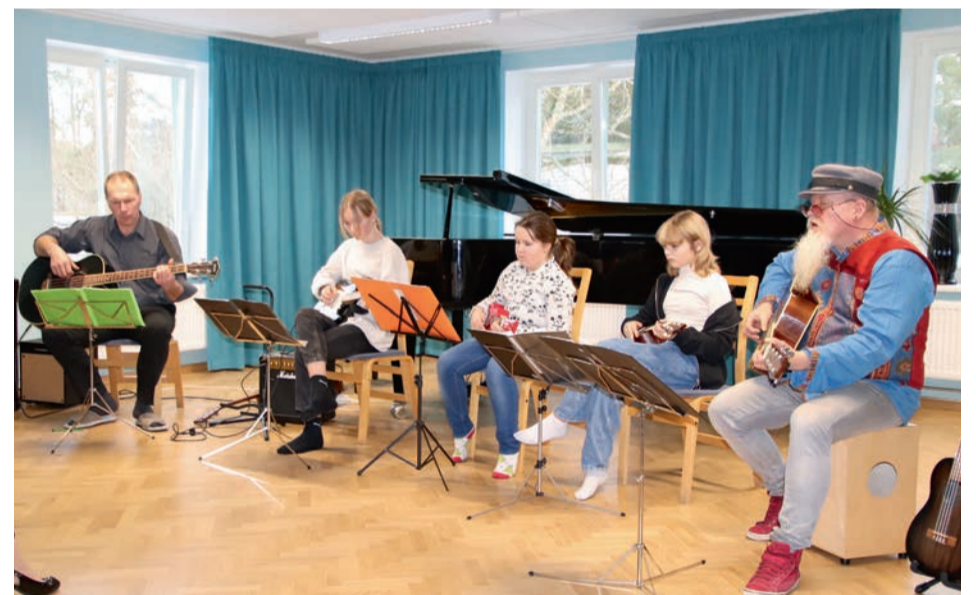
Näppepillide õpilased koos õpetajaga.