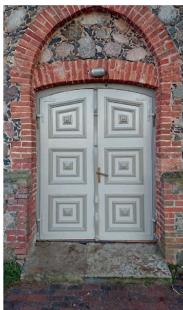
Vana uks ja uus uks.

Häädemeeste Eakate Kodu ootab oma sõbraliku kollektiiviga liituma