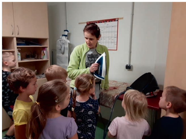
Jaanimardikate rühm tutvumas perenaise tööga.