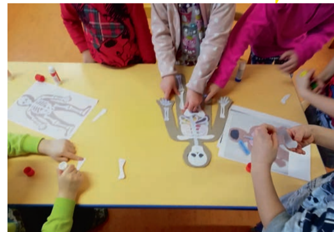
Sellised oleme seestpoolt.

Rannakarbid sukeldusid sügavamalt tervisemaailma. Arutleti, missugused tegevused on tervisele kasulikud, missu-