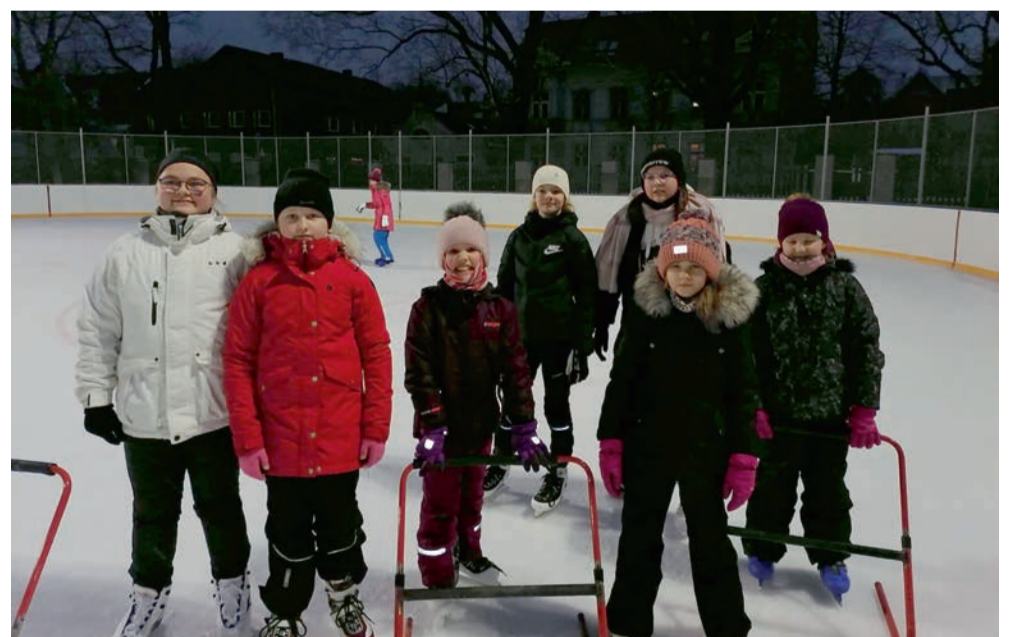
Võiste noortetoe lapsed Pärnuses uisutamas.

Oleme noortekeskustes taaskord kokanud – Uulu lapsed said ise teha pannkooke ning kõik noortekeskuses viibinud lapsed said neid koos süüa. Võiste noortega meis-