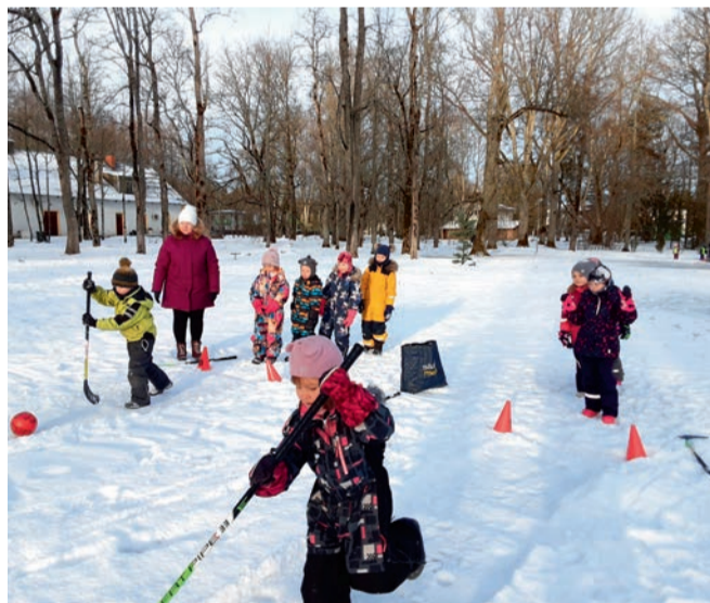
Talispordipäev Uulu lasteaias