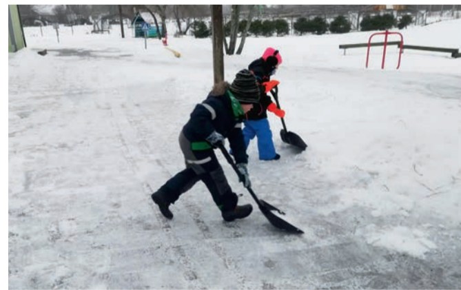
Kus lund, seal lükkajaid.