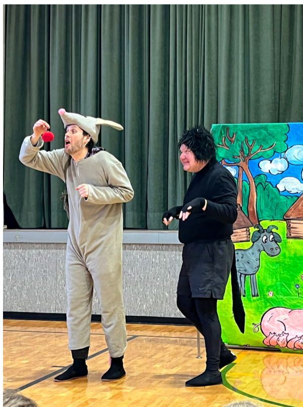
Teatrietendus „Kass kes kõndis omapead”.

Põrnikate lapsed on olnud tublid ja toimekad. Osavamaks on saanud käelistes tegevustes, selgeks on õpitud jõulukingitusteks saadud mängud.