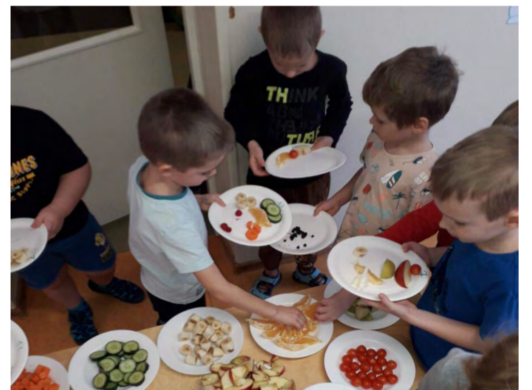
Rootsi laualt palju vitamiine.