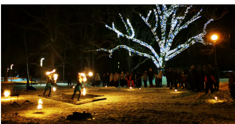
Kolmekuningapäev Uulus.