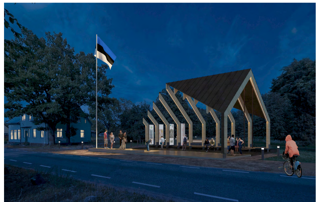
Perspektiivvaade, lahendust „Puhu tuul“ tutvustav poster.

seotud ajaloole ja võimaldab tutvustada siitkandi purjelaevade ehitamise, purjetamise, kaptenite-reederite ning merehareduse lugu.