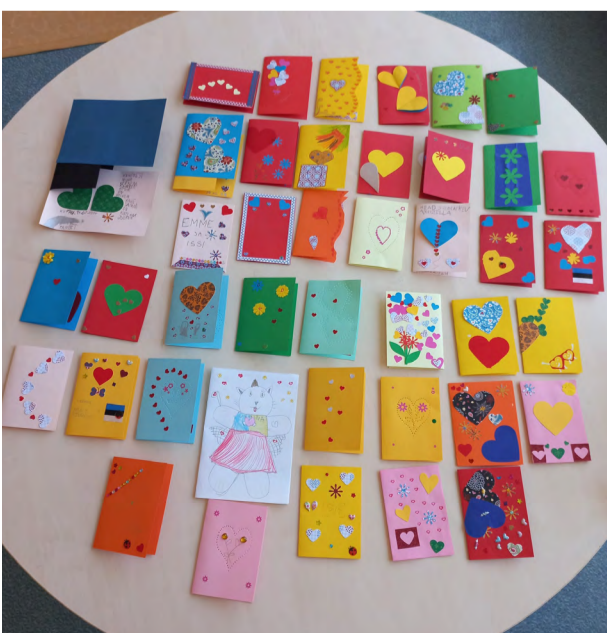
Sõbrapäeva kaardid.