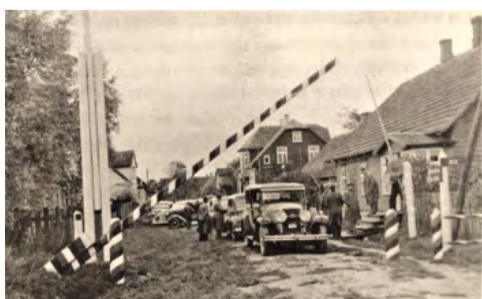
Ajalooline pilt. Ikla piirivalve punkt, omaaegne terviklik kahepoolse hoonestusega tänavafont, 1930-ndad. Pärineb internetiavarustest.

Viimased sadakond aastat on mööda maismaad lõuna poolt Eestisse tules olnud esimene asustatud punkt väike Ikla küla. Pikemas vaates on see tänane Häädemeeste valla nurk omapärase ja mitmepalgelise ajaloo. Kunagisel liivlaste asustatud alal märkab teadja pilk tänaseni jälgi liivi mõjudest nii eestlaste kui ka meie naabrite lätlaste hulgas. Kolme keelt ja kultuuri seob ja kõnetab omapärasel viisil vana liivlaste pulmalaua, üks liivi kultuuri tüvitekte „Puhu tuul ja tõuka paati“. Siit ka Vana-Ikla piiripunkti lahenduse kontseptsiooni nimi.