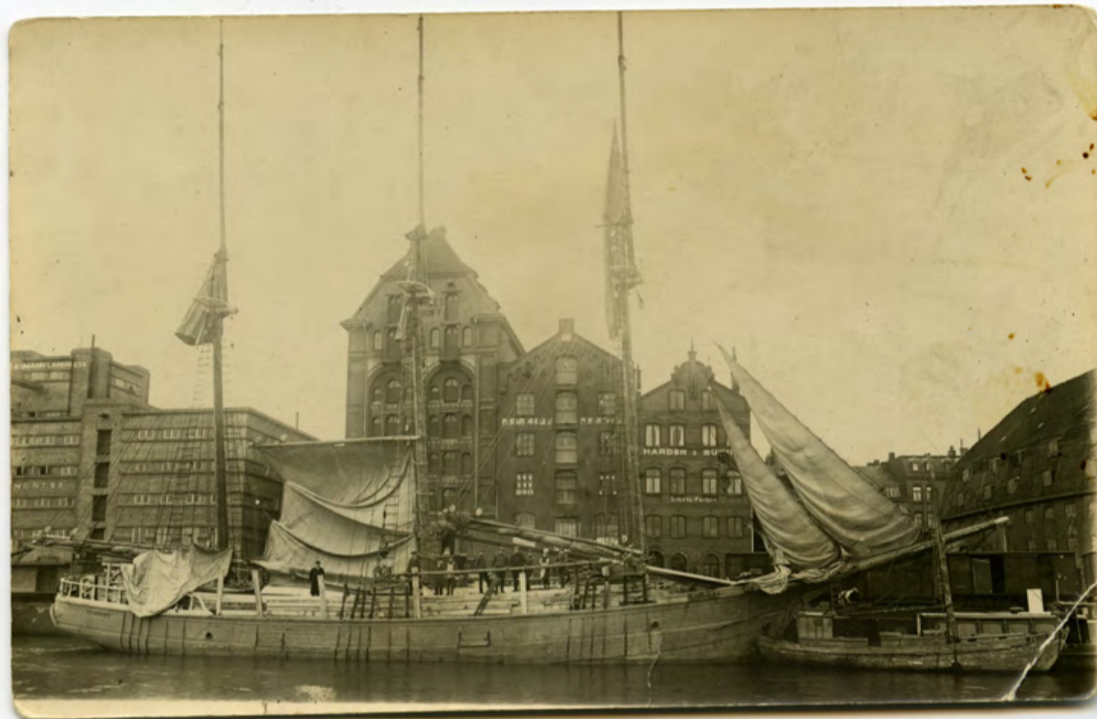
Kahvelkuunar Lemming (1921; 214 brt) Kieli kalasadamas.