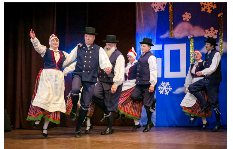
Rahvatantsu traditsioone hoidev Lendar tantsuhoos.