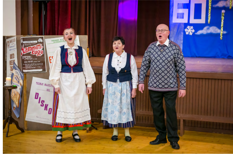
Jah, elu on pagana vahva..., laulab Treimani Trio.

Juubelipidu külastas Liiviranna toimetus