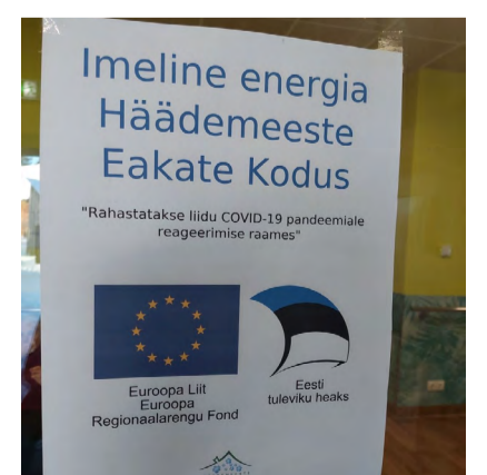
Projekti teavituse plakat.