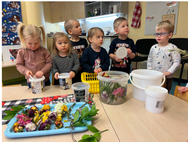
Jäälaternate valmistamine Uulu Lasteaias.

Lapsed õppisid nimetama vahvaid meil talvituvaid punase ja kollase kõhuga linde.