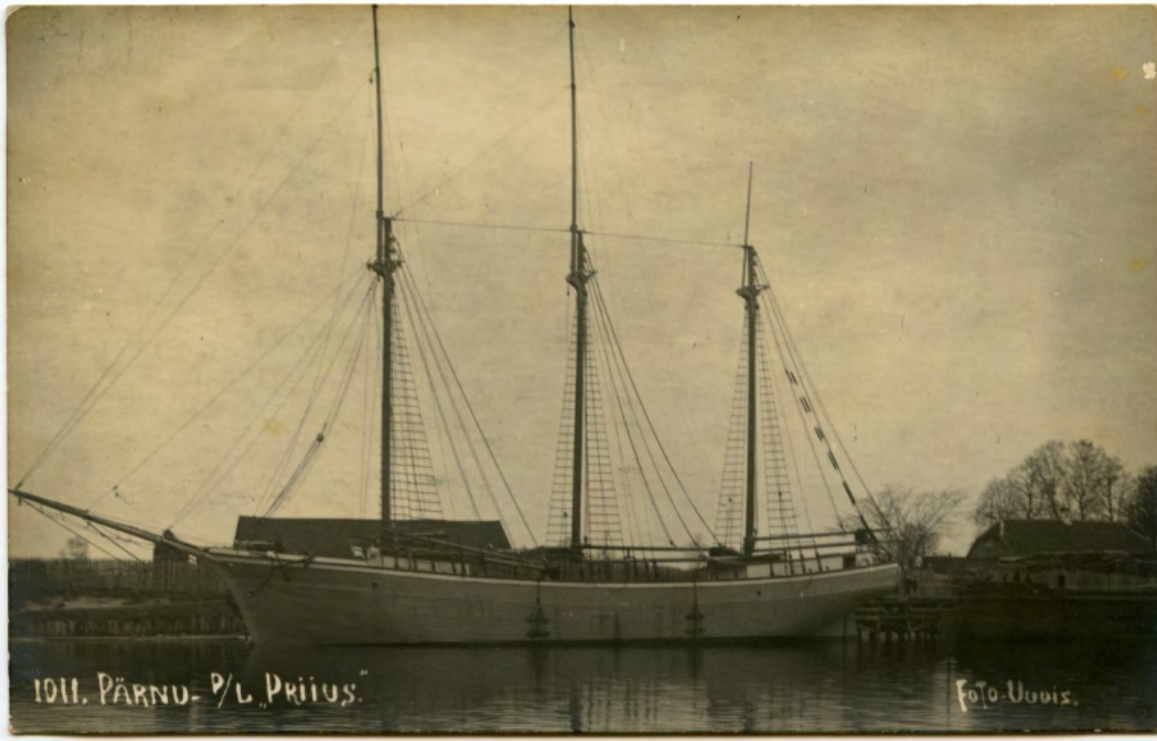
Kuunar Priius (1921; 260,3 brt) Pärnus.