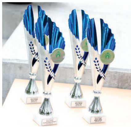
2023-2024 õppeaasta tiitlid