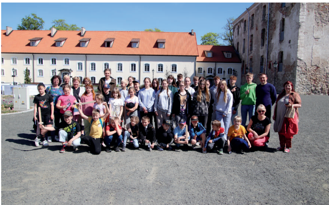
Metsapoole koolipere Põltsamaa lossihoovis