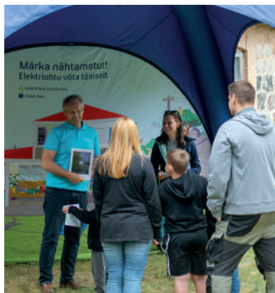
Elektrilevi OÜ tegevuspunkt

panustasite, on hindamatu väärtusega. See üritus polnud lihtsalt matk looduses, vaid kogukonna ühendamine, uute sõpruste tekkimine ja meeskonnatöö väärtuste esiletõstmise. Tänu teile kõigile saime kogeda midagi erakordset, mis jääb meile meelde veel pikaks ajaks.