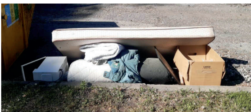
Rannametsa parkla konteineri ümbrus 2024. aasta mais

Palume kõigil, kes ise sorteerimisest lugu ei pea, olla teiste suhtes lugupidavam!