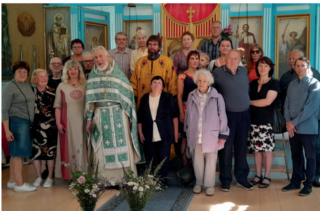
Ühispilet osalejatega