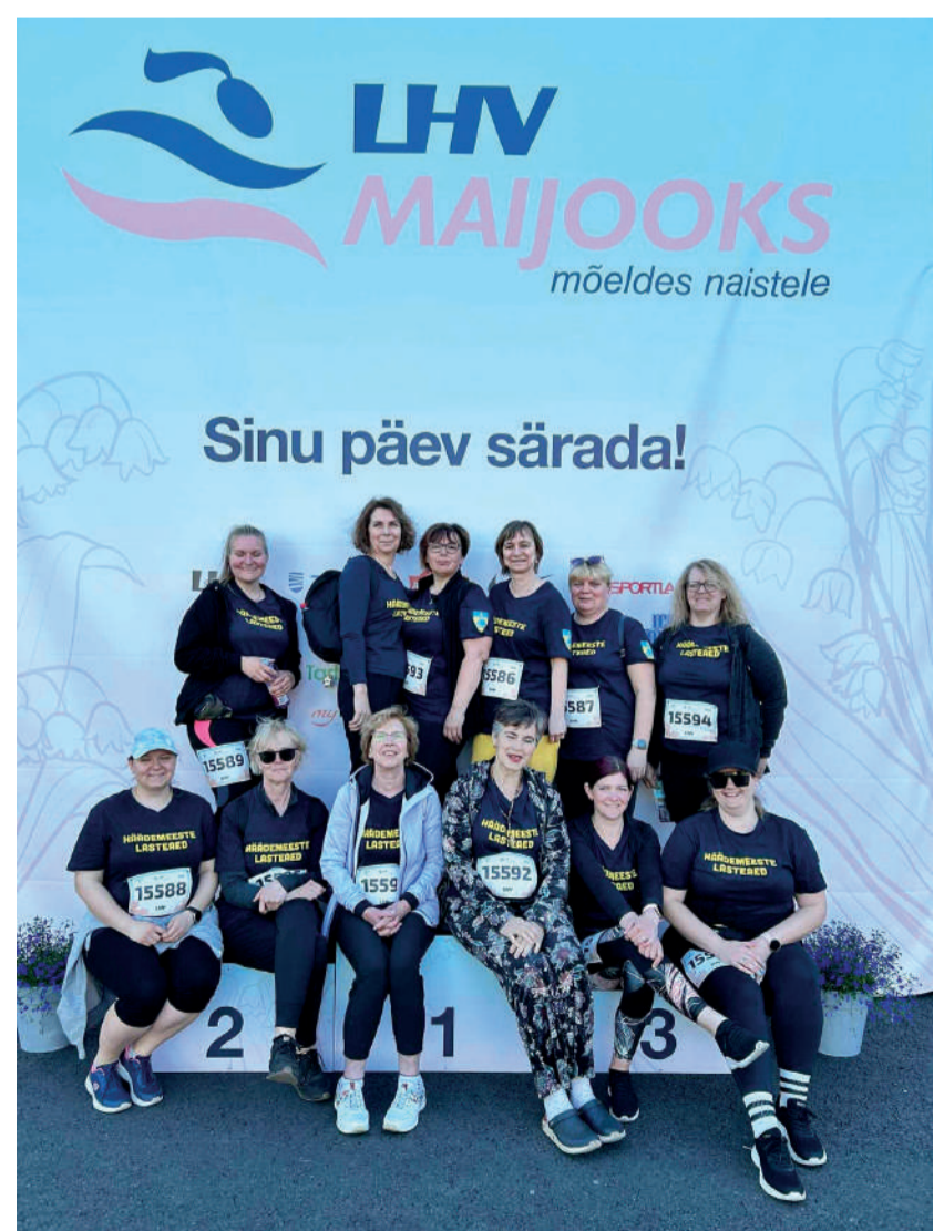
Maijooks 2024, Häädemeeste lasteaiasportlikud naised