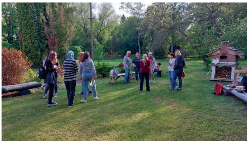
Pitsaõhtu Saksa külalistega.

Järgmise tegevuse käigus vaadati Pärnu natukene teise nurga alt – sõites jõel väikese laevaga. See oli uus ja tore kogemus! Kui jõel tiirud tehtud, oli võimalus tutvuda linna vaatamisväärsustega ning nägemata ei jäänud ka Pärnu rand. Välismaa külalistele pakkus meri palju eelavust, sest nad ise elavad merest üpris kaugel.