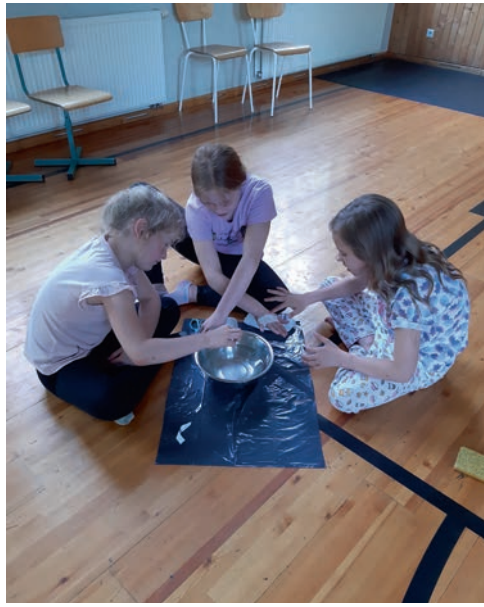
Kooliõöl kipsisjäljendit tegemas