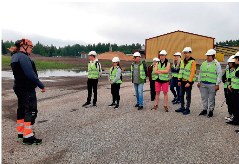
Saksa külalised Lecas

Kolmapäeval viis õppekäik projektimeeskonna Pärnu kutsehariduskeskusesse. Tutvuda sai paljude erinevate erialadega – keevitaja, elektrik, juuksur, kokk, õmbleja, automehaanik, tisser, hooldaja ja mitmeid veel. Kindlasti leidis igaüks omale mõne huvitavat ala ning ideid tuleviku tarbeks.