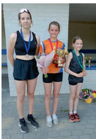
Tüdrukute B klassi esikolmik