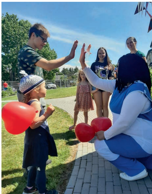
Külalisi, nii suuri kui väikeseid, löbustas Sipsik