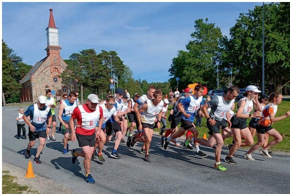
Võidupüha jooksu start