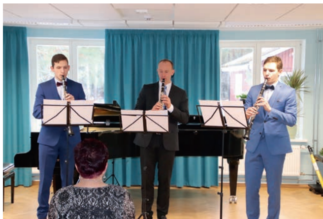
Muusikakooli puhkpilliõpilased ja õpetaja uuendatud koolimaja avamisel.

Õeldakse, et matemaatika ja muusika käivad käsikäes. Muu-